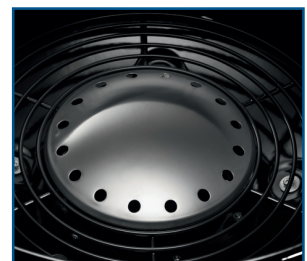
Edelstahl-Reflektorscheibe für direktes Grillen