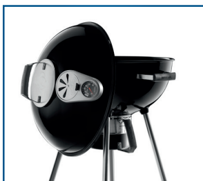
Mehrzweck- Deckelaufhängung im Deckel integriert