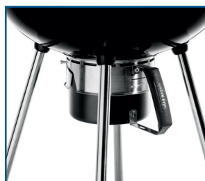
Aschetopf und regulierbares Lüftungssystem